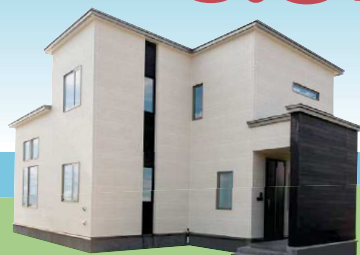
アイビーホーム株式会社