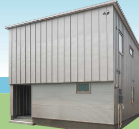
株式会社 菅原工務店 SUGAWARA