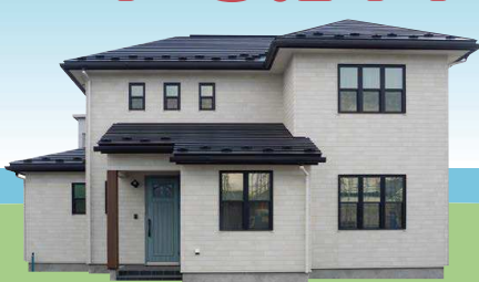
神出設計 ecoa House エコアハウス