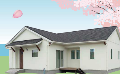
株式会社 渡辺工務店 watanabe ko-muten