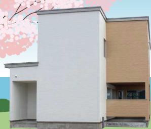
HHI 建成ホーム (株) 苦小牧支店