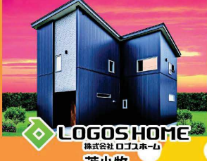
LOGOS HOME 株式会社 ロゴスホーム 苫小牧