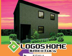
LOGOS HOME 株式会社 ロゴスホーム