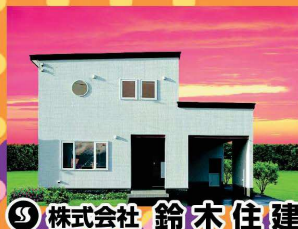
株式会社 鈴木住建