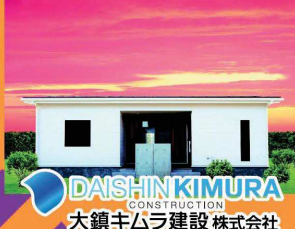
DAISHINKIMURA 大鎮キムラ建設 株式会社