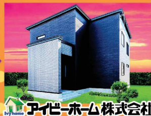
アイビーホーム株式会社