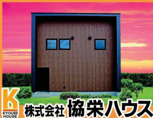
株式会社 協栄ハウス