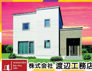
株式会社 渡辺工務店