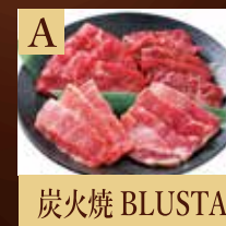
A 炭火焼 BLUSTA

スタンプラリー完走後、用紙 にご希望の商品番号をご 記入いただき最後にご覧 いただいたモデルハウスでお 引き渡しください。