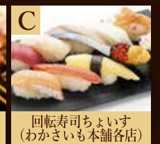
C 回転寿司ちよいす (わかさいも本舗各店)